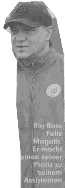
Big Boss Felix Magath: Er macht einen seiner Profis zu seinem Assistenten